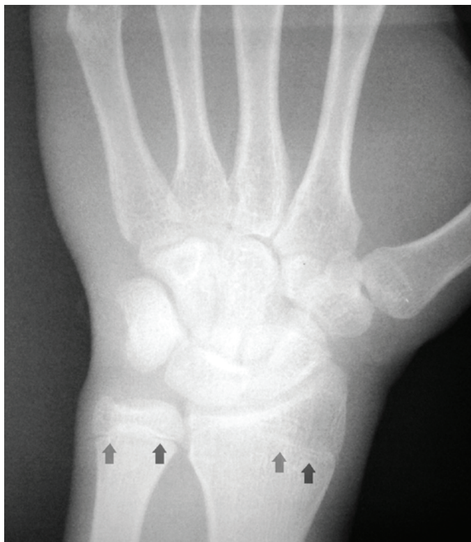
Figura 2. Radiografia carpal evidenciando a fusão incompleta de rádio e ulna (setas).

é compatível com a de um indivíduo do sexo masculino de 17 anos e é incompatível com a de um indivíduo do sexo masculino de 18 anos (Figura 2).