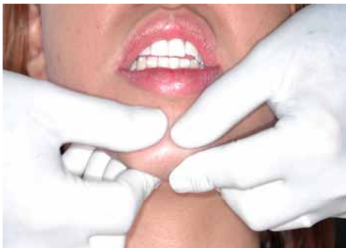
Figura 1. Manipulação bimanual de Dawson 15 .