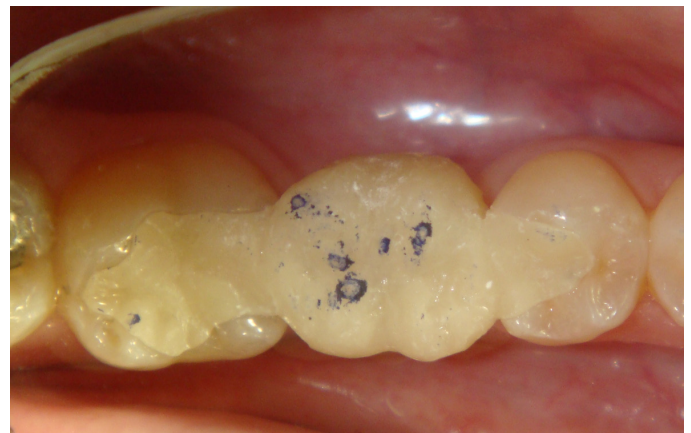
Figura 7. A- Primeiros contatos oclusais demarcados previamente à cimentação, destacando contatos prematuros;

Antes (com cuidado) e após a cimentação foi feito ajuste oclusal de modo a possibilitar contatos bem distribuídos em máxima intercuspidação e alívio dos dentes posteriores em movimentos protusivos ou látero-protusivos (Figuras 7A e B). O repolimento pós-ajuste foi feito com pastas diamantadas (FGM) granulação média e fina com borracha de óxido de alumínio e escova de pelo de carneiro para brilho final ( Ultradent ).