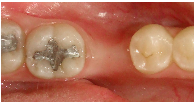
Figura 1. A- vista oclusal destacando restauração de amálgama no 37, dente 35 hígido, e espaço protético moderado.

Na primeira sessão foram executados preparos expulsivos do tipo inlay OD e MO nos elementos 35 e 37, respectivamente, sendo que no elemento 37 aproveitou-se a cavidade deixada após remoção do amálgama (Figura 3 e 4). Os preparos foram