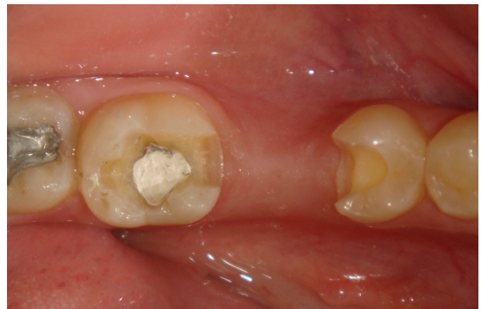
Figura 4. Preparo conservadores do tipo caixa oclusal com degrau proximal MO no 37 e DO no 35. Profundidades:caixa oclusal = 2,5mm; caixa proximal=máximo possível mantendo término supragengival.