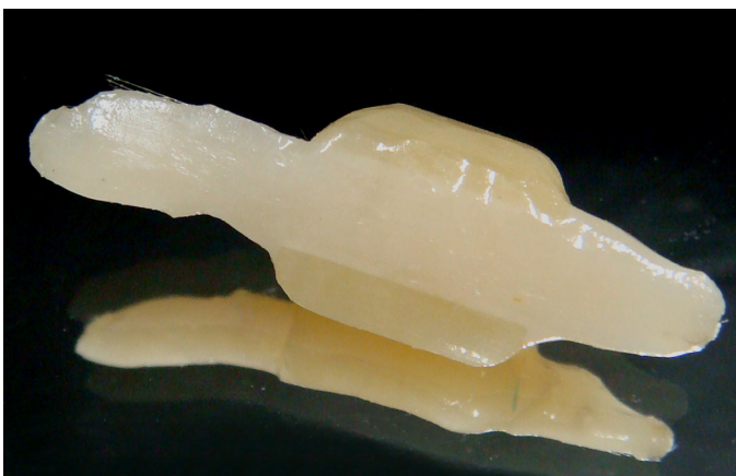
Figura 6. Infraestrutura pronta em fibra de vidro jateada e silanizada.