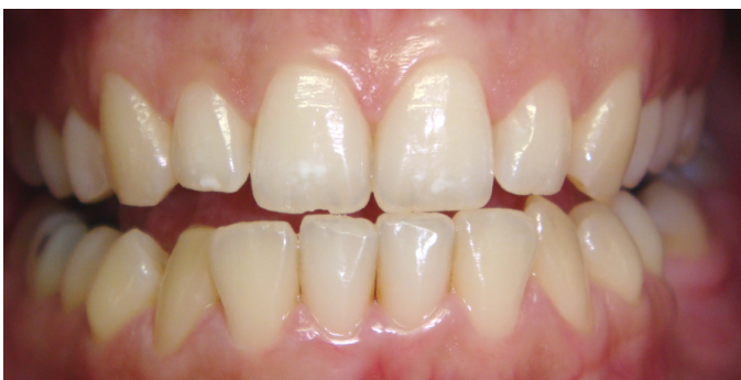
Figura 2. Movimento protrusivo com toque acentuado somente entre 11 e 31, havendo pequena fratura prévia na incisal do 11, embora haja desocclusão dos posteriores.