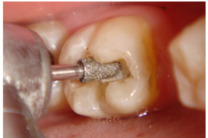
Figura 3. Confeção do preparo conservador no 37 pela remoção exclusiva da restauração de amálgama e retenções. Ponta diamantada n.3131.