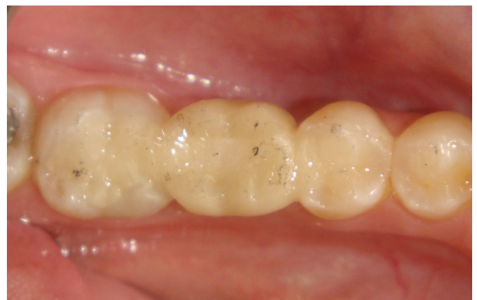
Figura 7. B- Contatos oclusais já ajustados pós-cimentação.