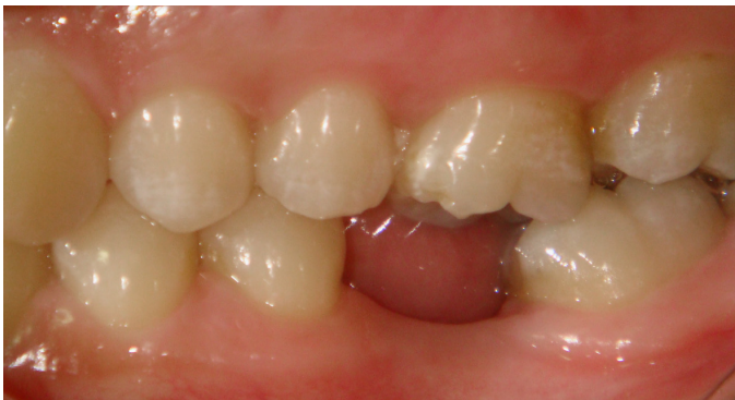
Figura 1. B- espaço protético visto de lado destacando presença fundamental de altura cérvico-oclusal para a reabilitação por prótese adesiva reforçada por fibra, e distância moderada entre os dentes pilares.