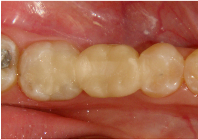
Figura 8. Aspecto final do caso com restauração da função oclusal e harmonia estética.

O uso de prótese adesiva com reforço de fibras de vidro possibilitou restaurar o espaço edêntulo com função e estética (Figura 8). O caso resultou em uma solução conservadora de prótese adesiva, pois houve economia de desgaste do tecido dental no dente 35, que era hígido, e do elemento 37 que aproveitou o preparo prévio da restauração existente.