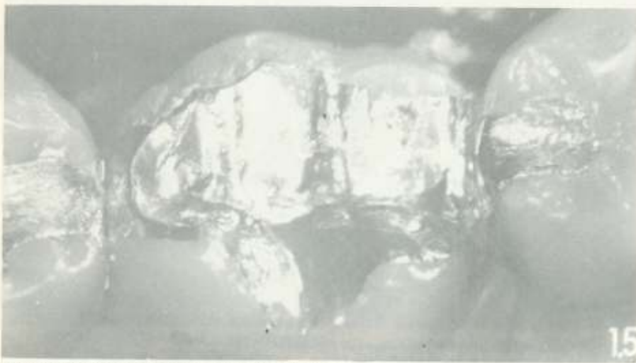
Fig. 2 - Restauração polida com preservação de 29 meses

Em seguida confecciona-se um chanfrado na margem cavo-superficial do orifício com broca esférica lisa, de diâmetro ligeiramente maior que a perfuração, em baixa rotação, com a finalidade de permitir maior volume de amálgama e consequentemente maior resistência do material restaurador na região.