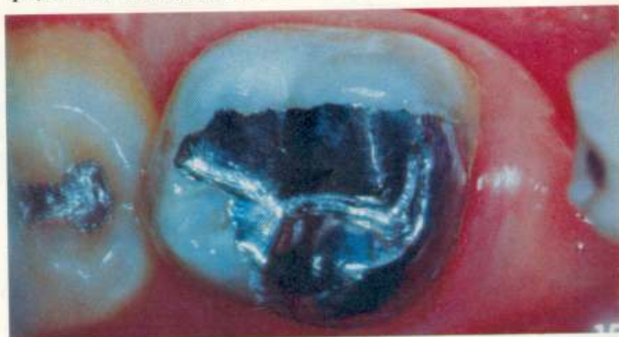
Fig. 4 - Reconstituição da cúspide méso lingual em segundo molar inferior

Na nossa avaliação ressaltamos que, dentre os 27 dentes restaurados