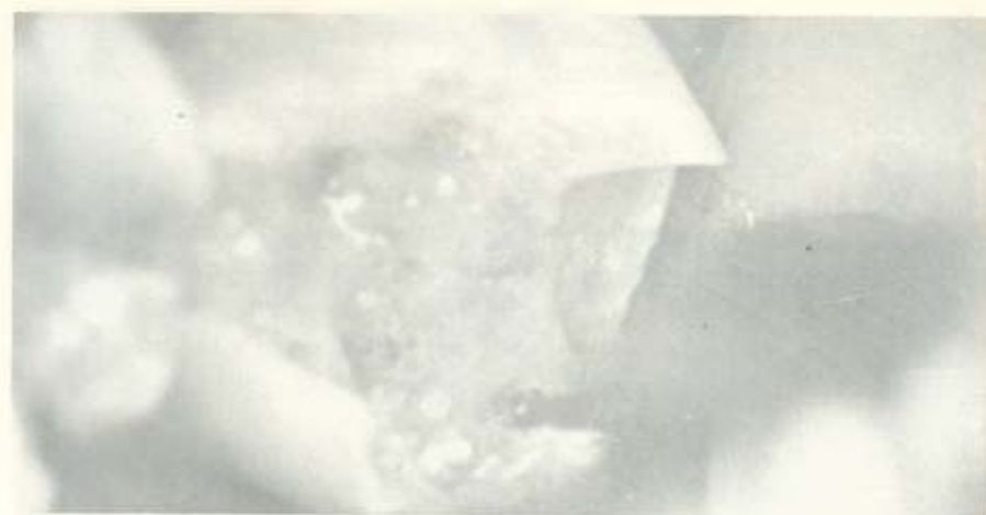
Fig. 1 - Execução do orifício sob a cúspide méso lingual do 46

A proteção pulpar era efetuada com cimento de hidróxido de cálcio (cavidades profundas) ou cimento de ionômero de vidro, tendo o cuidado de não deixá-los penetrar nos orifícios retentivos, que recebiam apenas o verniz cavitário.