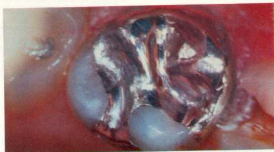
Fig. 5 - Aspecto clínico de uma restauração extensa, 36 meses após sua confecção

diâmetros oferecem clinicamente a mesma retenção e resistência.