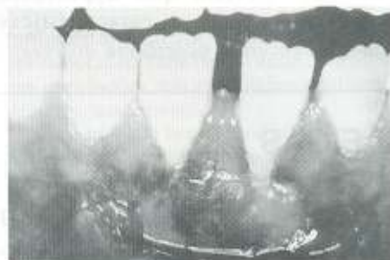
Fig. 3: Pós-operatório de 10 dias na remoção da sutura. Enxerto em processo de maturação