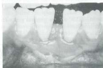
Fig. 5: Pós-operatório de 1 ano. Migração coronária tardia da margem gengival. Recobrimento radicular parcial