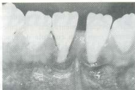
Fig. 1: Aspecto pré-operatório. Recessão gengival em incisivos centrais inferiores

A importância de uma faixa adequada de gengiva inserida como condição necessária para a manutenção de saúde periodontal é amplamente questionada e discutida na literatura 3,14,15,16 . Recessões gengivais não ocorrem devido à pequena quantidade ou ausência de gengiva inserida, mas sim pela presença ou não da doença periodontal 15 . Desta forma, a necessidade da correção deste tipo de lesão é controversa, visto que a saúde do tecido marginal pode ser mantida, livre de inflamação, não sendo, necessariamente, progressiva. No caso