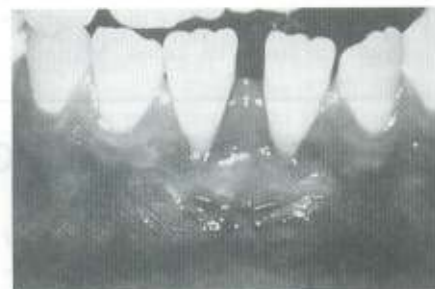
Fig. 4: Pós-operatório de 1 mês. Aumento na largura de mucosa queratinizada