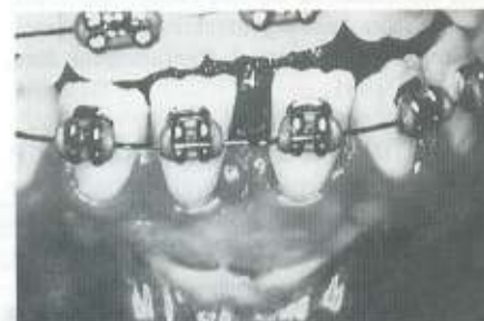
Fig. 6: Pós-operatório de 2 anos. Completo recobrimento radicular em consequência de creeping attachment

clínico relatado, a opção pelo tratamento foi atribuída à necessidade de restabelecer a saúde periodontal comprometida pela dificuldade no controle de placa e ao inconveniente estético que a recessão gengival acarretava à paciente.