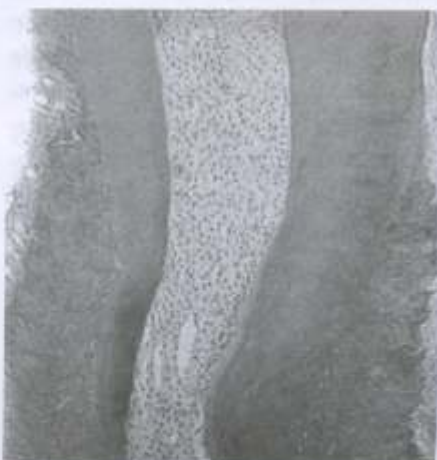
Figura 3 - Observe que o processo reacional iniciado na polpa coronária está evoluindo em direção à polpa radicular, a qual ainda apresenta-se estruturalmente organizada. H/E, 56x.