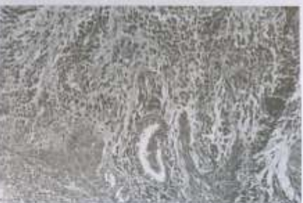
Figura 4 - Região periapical de um dente, cuja polpa coronária e radicular apresentavam-se contaminadas e com total degradação. Note a intensa proliferação fibroangioblástica no local associada a intenso infiltrado inflamatório de predomínio mononuclear. Em meio a este tecido reacional, pode-se observar verdadeiros nódulos de células epiteliais pavimentosas estratificadas. H/E, 160x.