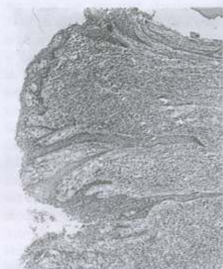
Figura 6 - Detalhe da figura anterior. Observe o epitélio revestindo internamente a cavidade cística. O tecido conjuntivo subjacente exibe intensa reação inflamatória. H/E, 96

Summers & Papadimitriou 20 (1975) avaliaram as características de proliferação do tecido epitelial, fator essencial na transformação do granuloma para cisto periapical. Através de um marcador identificaram as células epiteliais que passavam por este processo proliferativo, ou seja, algumas células da periferia do granuloma, visto que as células que não se