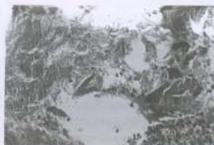
Figura 1 - Área da polpa coronária exposta e contaminada por microrganismos. Note a evolução parcial do processo de necrose tecidual para a formação de abscesso local. H/E, 160x.

O granuloma periapical é uma massa de tecido de granulação crônico no ápice dental, formado em resposta à infecção. Este tecido de granulação corresponde a uma proliferação fibroangioblástica. Primeiramente, o intuito desta reação é eliminar as substâncias nocivas que obstruem os canais dentais, ou seja, o fluxo, ativação e coordenação das células imuno-inflamatórias com as células do periápice representam a reação de defesa do hospedeiro contra os agressores desta área.