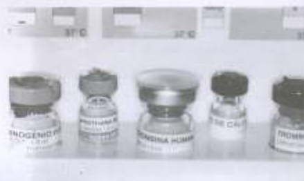
Componentes do adesivo fibrínico

Fibrinic tissue adhesive; hemostasis; blood coagulation.