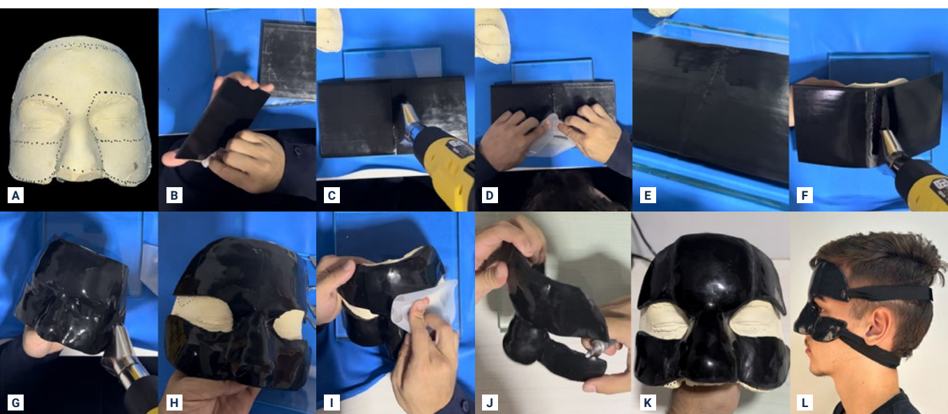
FIGURA 5 - Protocolo laboratorial de confecção do protetor facial individualizado. (A) Delimitação da área a ser ocupada pelo protetor facial individualizado; (B) Limpeza das placas e da mão do operador; (C) Termoplastificação para união de placas de EVA; (D) União por pressão digital; (E) Aspecto final após a união das placas de EVA; (F) Termoplastificação no modelo de gesso; (G) Aspecto final após termoplastificação e pressão digital; (H) Recorte do protetor facial; (I) Termoplastificação e acomodação da camada de reforço; (J) Acabamento e polimento; (K) Aspecto final; (L) Adaptação das tiras elásticas com velcro.

Alemanha) e escovas Scotch Brith nas granulções grossa, média e fina (American Burrs, Santa Catarina, Brasil), objetivando que as superfícies fiquem lisas para promoção de conforto e estética ao protetor facial (Figura 5J); Etapa 11 – Termoplastificação final com soprador térmico de forma a renovar o brilho, além de verificação do aspecto final e da adaptação ao modelo de trabalho (Figura 5K); Etapa 12 – Perfurações laterais nas porções superiores e inferiores para adaptação de tiras elásticas com velcro, afim de corrigir os limites de ajuste pericraniano e fornecimento de estabilidade durante a prática esportiva (Figura 5L).