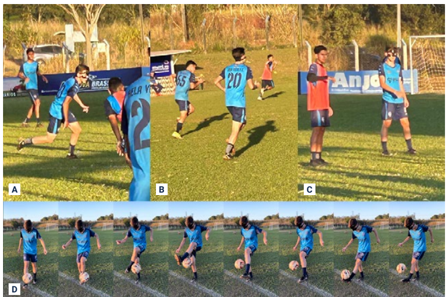
FIGURA 7 - Treinamento 30 dias decorridos do trauma. (A) Disputa de bola; (B) Período de adaptação ao uso; (C) Conforto de utilização do protetor; (D) Sequência de demonstração de controle de bola normal.