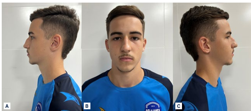
FIGURA 3 - Fotos iniciais. (A) Vista lateral esquerda; (B) Vista frontal; (C) Vista lateral direita.

Paciente, portanto, compareceu a clínica da Universidade Salgado de Oliveira Filho (UNIVERSO) na Liga Acadêmica Goiana de Odontologia do Esporte (LAGOE) para confecção de um protetor facial individualizado (Figura 3A - C). O Termo de Consentimento Livre e Esclarecido (TCLE) foi assinado pela responsável e pelo paciente. A técnica utilizada para confecção do protetor facial individualizado respeitou o protocolo descrito abaixo, de acordo com parâmetros de confecção estabelecidos pela literatura 33,34 .