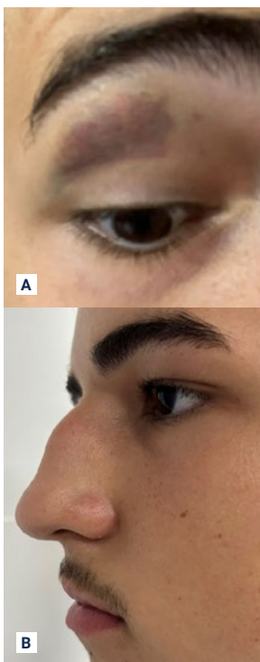
FIGURA 1 - Aspecto clínico após 7 dias do trauma facial. (A) Hematoma periorbital; (B) Edema nasal.

do trauma e consulta médica. O paciente compareceu a dois médicos, um especialista em ortopedia e outro especialista em medicina esportiva, sendo que os dois concordaram que o processo de cicatrização já se encontrava em estado avançado e que o atleta deveria realizar o uso das medicações: Alektos® 20mg (1x ao dia durante 15 dias), Predsim® 20mg (12/12 horas durante 05 dias) e lavar de forma abundante todo o coágulo presente com Nasonex® (aplicar 1 jato de 12/12 horas durante 30 dias) e Sorine Jet® (Aplicar 2 jatos 3/5x ao dia). Além disso, a equipe médica concluiu que o procedimento de redução cirúrgica da lesão só seria necessário para questões estéticas, visto que a funcionalidade não havia sido afetada. Ademais, foi solicitado a utilização de uma máscara de proteção facial afim de proteger a área lesionada, evitando novas fraturas e possibilitando retorno aos treinamentos com segurança.