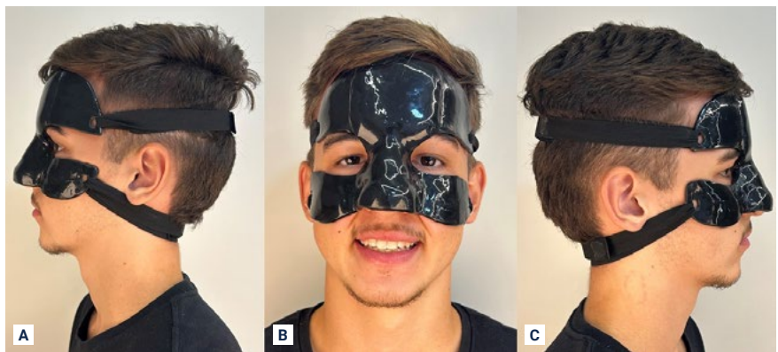
FIGURA 6 - Protetor facial individualizado. (A) Vista lateral esquerda; (B) Vista frontal; (C) Vista lateral direita.

O paciente seguiu em acompanhamento pelo período de 90 dias e já realizou o procedimento cirúrgico de Septoplastia (re-centralização do septo nasal) e Adenoidectomia (remoção das Adenóides) para correção estética e redução de possível prejuízo funcional para o processo de respiração do atleta.